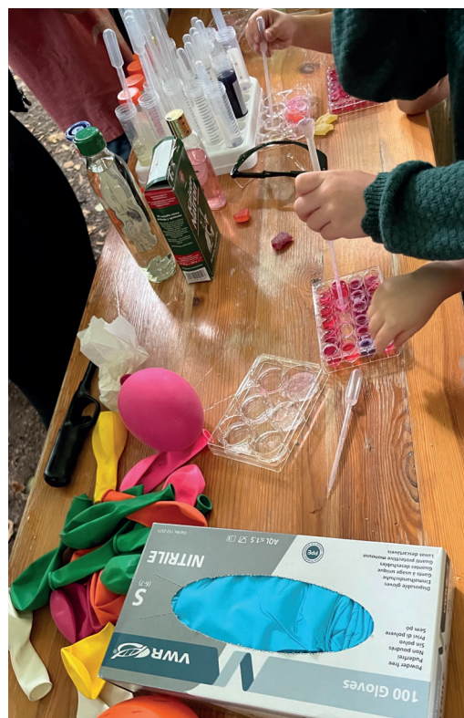
Kinderhände im „Forschungslabor“ im Park beim Experimentieren.

Das Event kam so gut an, dass wir innerhalb von drei Stunden mit etwa 70 Kindern beschäftigt waren und Eltern uns direkt nach