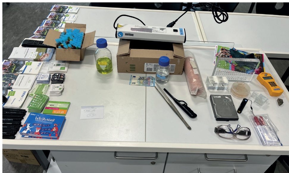
Anschauungs- und Informationsmaterialien und Goodies vor Beginn einer Schulstunde.

Wie so oft bei (Wissenschaftskommunikations-)Projekten, die neben